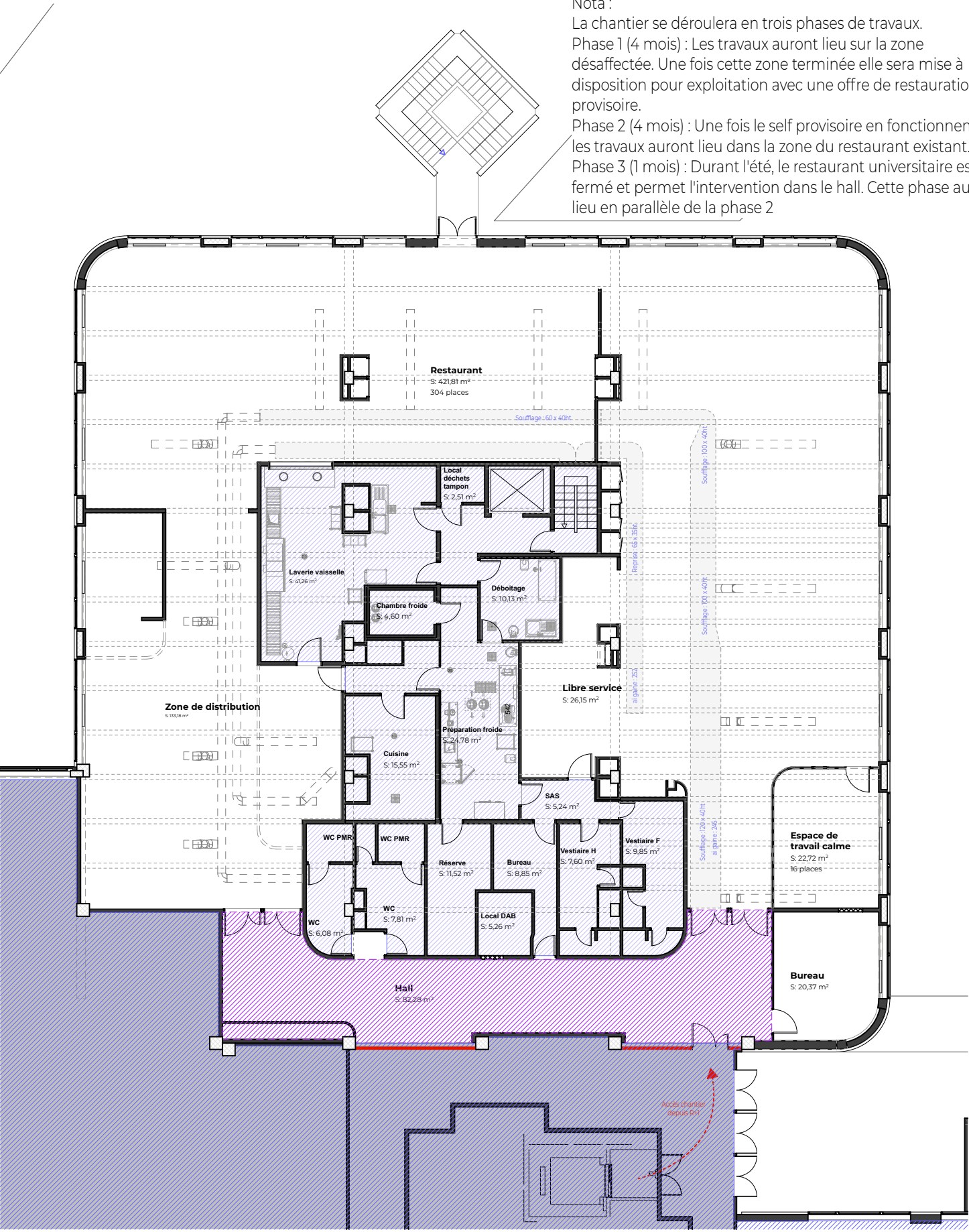
Plan phase 3 - Durant l'été pendant la fermeture du restaurant universitaire en parallèle de la phase 2

Nota : La chantier se déroulera en trois phases de travaux. Phase 1 (4 mois) : Les travaux auront lieu sur la zone désaffectée. Une fois cette zone terminée elle sera mise à disposition pour exploitation avec une offre de restauration provisoire. Phase 2 (4 mois) : Une fois le self provisoire en fonctionnement, les travaux auront lieu dans la zone du restaurant existant. Phase 3 (1 mois) : Durant l'été, le restaurant universitaire est fermé et permet l'intervention dans le hall. Cette phase aura lieu en parallèle de la phase 2